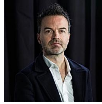
Ghislain de Vaulx